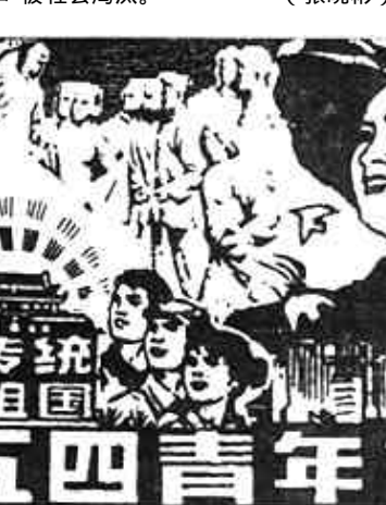
继承五四传统 青春献给祖国 纪念五四青年节

垦利县技术监督局团组织注重对团员加强素质教育,不断提高团员的业务素质。“五·四”青年节即将到来之际,为使节日过得富有意义,他们给每位团员发了五本小册子作礼物,其中包括《产品质量法》、《计量法》等与业务相关的法律法规。虽然60%的团员是大专院校的毕业生,可他们的学习态度却很认真。团员们认为:现在是竞争的年代,年轻人应该把主要精力放在学习上,不断提高自身能力,才能适应工作需要,不会被社会淘汰。 (张晓彬)